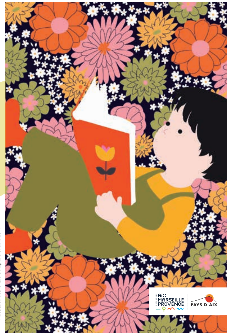
Illustration couverture © Delphine Chedru 2019

Pertuis - du mardi 19 au samedi 23 mars 2019